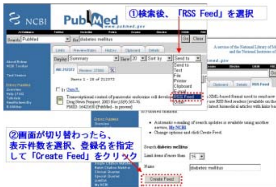
図1 PubMed RSS登録方法(1)

登録画面では表示件数と登録名を指定することができるが、初期設定のままでもかまわない。最後に「Create Feed」をクリックする。(図 1 PubMed RSS 登録方法 (1) )